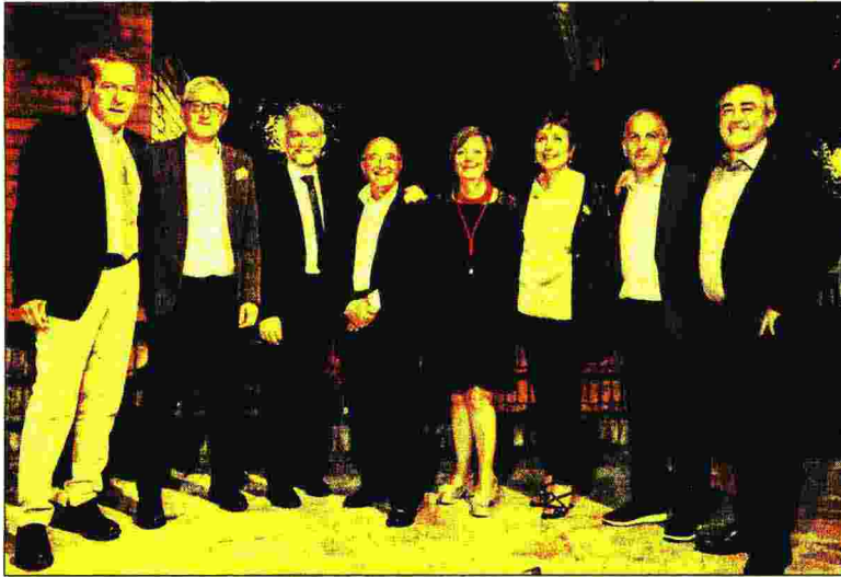
Il Consiglio nazionale AncoT

«Al di là dell'analisi della situazione di contesto è nostra abitudine anche propor-