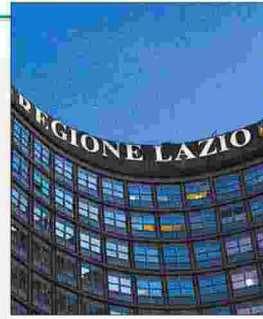
La Regione Lazio